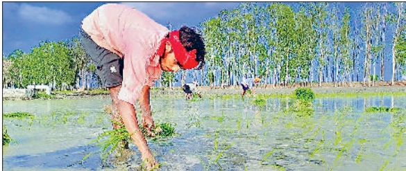
जौद। खेत में काम करते किसान।

जिले में मानसून सीजन में खुलकर बारिश न होने से मौसम में बनी उमस ने लोगों के साथ-साथ किसानों की परेशानी को बढ़ाया हुआ है। धान रोपाई तथा रोपी गई धान फसल में पानी की जरूरत है। ऐसी हालात में किसानों को ट्यूबवैलों का सहारा लेना पड़ रहा है। तापमान में भी दो डिग्री का इजाफा हुआ है। गर्मी के साथ बनी उमस का असर जनजीवन पर भी देखने को मिल रहा है। बुधवार को