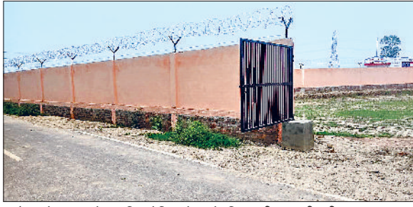
अलेवा। पेगा गांव में ड्राइविंग ट्रेनिंग सेंटर के लिए बनी चहारदीवारी।

गांव पेगा में पूर्व सीएम की घोषणा के छह साल बाद भी गांव के लोगों को ड्राइविंग प्रशिक्षण केंद्र शुरूआत के लिए काफी लंबा इंतजार करना पड़ रहा है। इसके लिए गांव के लोगों ने पूर्व सीएम मनोहर लाल खट्टर तथा डीसी तक को कई बार पत्राचार किया, लेकिन गांव के लोगों की मांग की तरफ अभी तक किसी प्रकार का