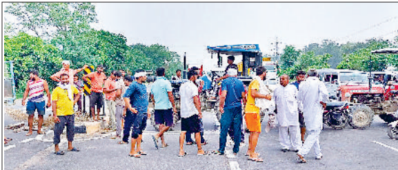
खरकभूरा रोड पर सड़क के बीच वाहन खड़े कर जाम लगाते।