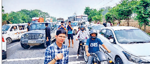
उद्यान। हाइवे जाम होने के चलते जाम में फंसे वाहन चालक।