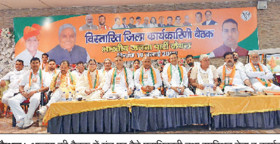
कैथल। भाजपा की बैठक में मंच पर बैठे पदाधिकारी तथा उपस्थित नेता व कार्यकर्ता