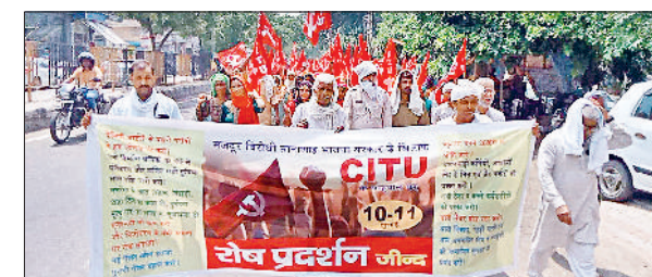
जौद। प्रदर्शन में भाग लेते मजदूर।