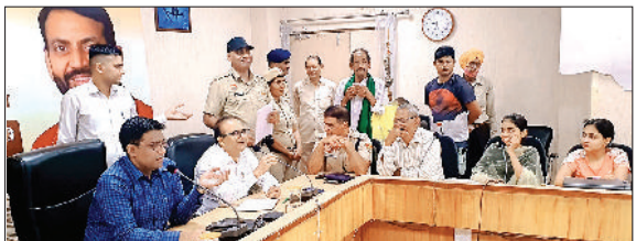
जीद। समाधान शिविर में शिकायतें सुनते डीसी व अन्य अधिकारी।