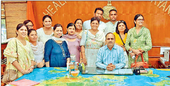
जीद। डीजी से मुलाकात करती आल नर्सिंग ऑफिसर्स वेलफेयर एसोसिएशन।

ऑल नर्सिंग ऑफिसर्स वेलफेयर एसोसिएशन हरियाणा ने नर्सिंग ऑफिसर्स की मांगों को लेकर स्वास्थ्य महानिदेशक (डीजी) हरियाणा डा. रणदीप सिंह पुनिया से मुलाकात की। साथ ही हरियाणा के मुख्यमंत्री से भी मुलाकात कराने के लिए समय दिलवाने का आग्रह किया। इसके लिए एसोसिएशन को एक सप्ताह का समय डीजी की तरफ से दिया गया। बुधवार को चंडीगढ़ पहुंची ऑल नर्सिंग