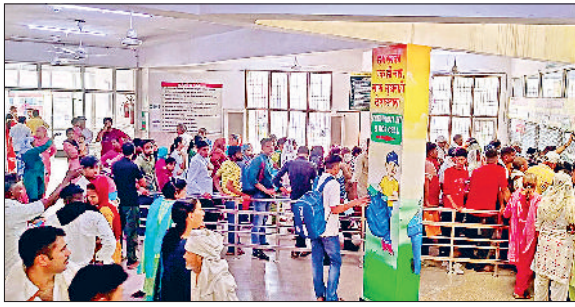
जीद। अस्पताल में ओपीडी के लिए लगी लाइन व चिकित्सक के कमरे के बाहर लगी भीड़।

राष्ट्रीय मानवाधिकार आयोग द्वारा जिला मुख्यालय स्थित नागरिक अस्पताल की व्यवस्थाओं पर संज्ञान लेते हुए हरियाणा सरकार के मुख्य सचिव को नोटिस जारी कर जवाब-तलबी की है। हालांकि अस्पताल प्रशासन को अभी तक नोटिस नहीं मिला है, बावजूद इसके अस्पताल प्रशासन जितना है उससे भी बेहतर देने के दावे कर रहा है। अस्पताल प्रशासन का कहना है कि समय-समय पर उच्च अधिकारियों को स्पेशलिस्ट चिकित्सकों की कमी, स्पेशलिस्ट, साजोसामान के बारे में अवगत करवाया जाता है। बावजूद