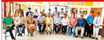
गुहला चीका। विद्यार्थियों व स्टाफ सदस्यों को सम्मानित करते हुए खंड शिक्षा अधिकारी।

खंड राजौद में ई अधिगम टीचर्स और ई अधिगम स्टूडेंट्स को किया सम्मानित